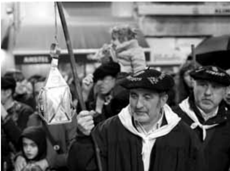
La tradicional makila decorada con un farol.