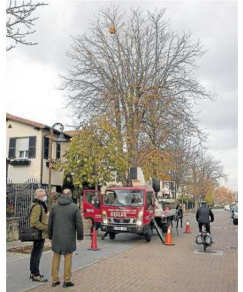
Retirada de un nido de avispa asiática en la calle Valle de Egüés, junto al Seminario.

En esa línea se ve preciso actuar en fase temprana para reducir al máximo el número